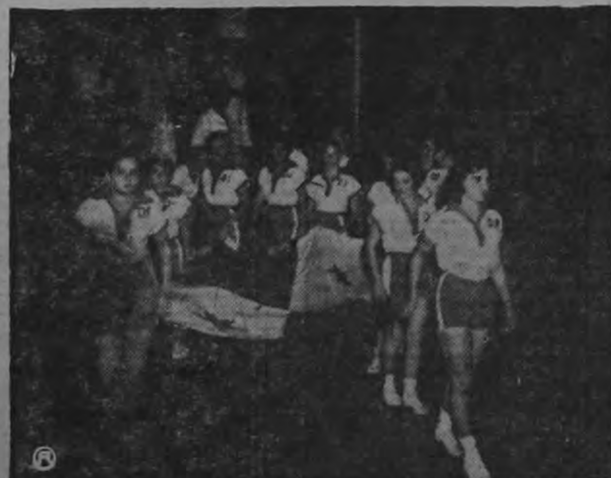
Las canasteras ticas hacen su entrada al floor del Gimnasio de David, Panamá, portando la bandera panameña.