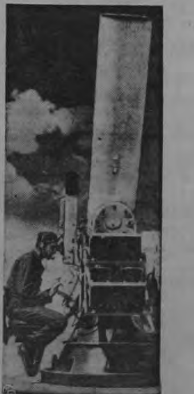
Este nuevo telescopio gigantesco en los terrenos de prueba de White Sands, Nuevo México, puede "ver" un proyectil a 300 millas (480 kilómetros) de distancia en color natural gracias a su lente de 160 pulgadas. El equipo giratorio que pesa toneladas y media está diseñado para funcionar con equipos de radar. Fué perfeccionado por los Laboratorios de Ingeniería del Cuerpo de Señales en Fort Monmouth, Nueva Jersey y embarcado a Nuevo México para nuevas pruebas.