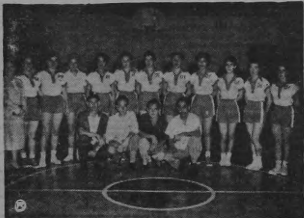
Las ticas del Deportivo Faerron ocuparon el tercer lugar perdiendo sus dos encuentros, pero dejando una magnífica impresión entre el público.