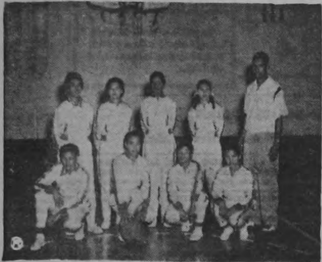
Las chiricanas se anexaron el título derrotando a las panameñas como a las ticas, demostrando una condición física extraordinaria.