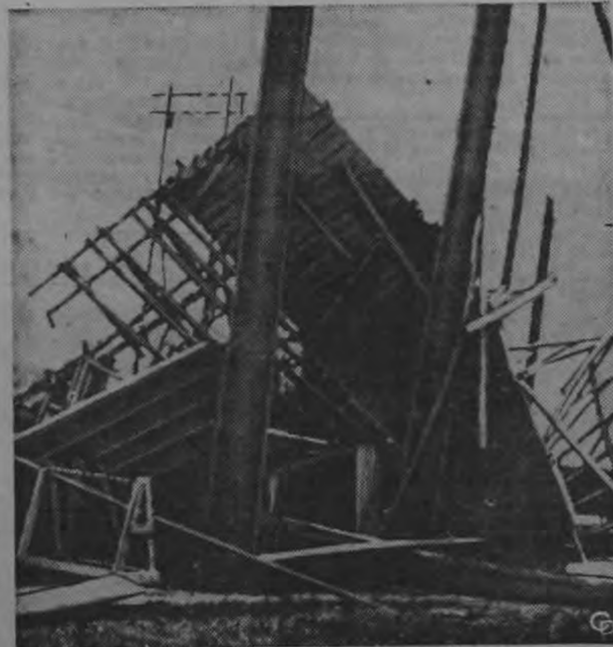
El tifón Harriett que azotó la Isla de Okinawa dejó esta instalación militar destrozada antes de continuar con vientos de 160 kilómetros por hora sobre la Corea del Sur y la parte sur y central del Japón. El tifón causó 29 muertes y pérdidas cuantiosas.