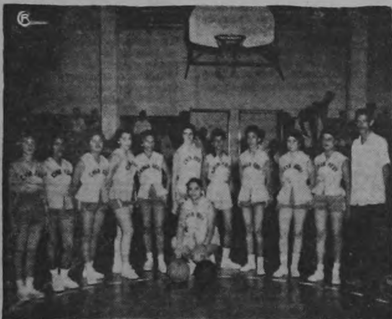
Las panameñas ocuparon el segundo lugar derrotando a las ticas y perdiendo solo ante las chiricanas. Son también jugadoras de grandes condiciones.